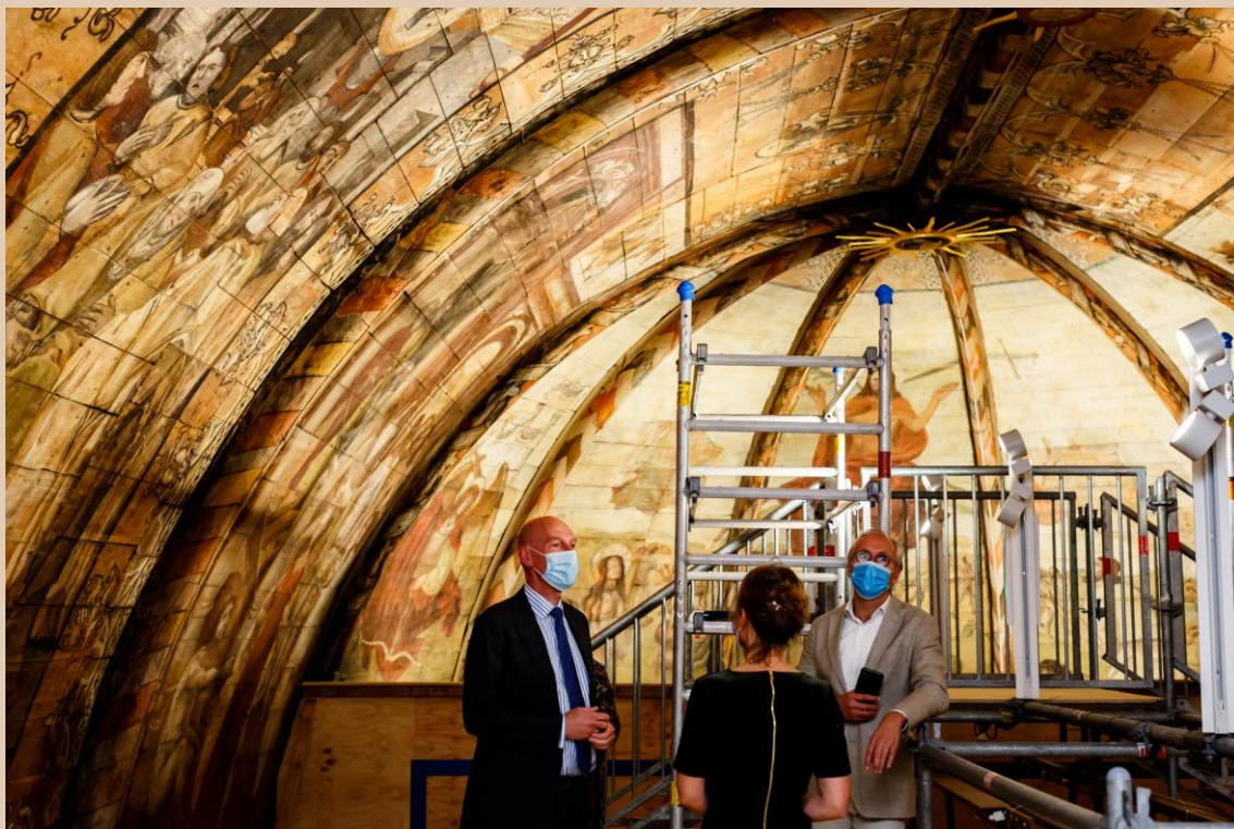
Opening Hemelbestormers 1 oktober 2020.

groepen van 10 onder begeleiding van een gids werden bezoekers d.m.v. een audiotour langs de schilderijen geleid. Daarnaast ontvingen we in de avonden diverse serviceclubs en andere groepen voor private views. Ook vonden previews plaats voor vestingbewoners, leden van de Protestantse Gemeente en Vrienden van Grote Kerk Naarden. De presentatie bleef, met een onderbreking in november, open tot half december, toen de tweede lockdown werd afgekondigd. Er kwamen in die periode 3000 betalende bezoekers op af waarmee vrijwel alle dagen uitverkocht waren.