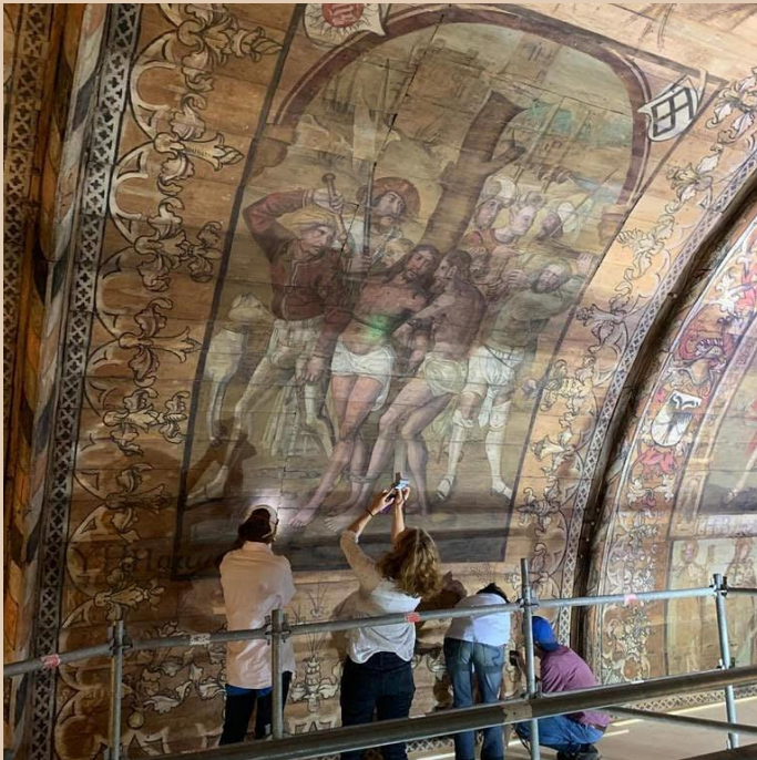
Restauratoren doen opnames aan het gewelf.