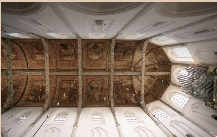
Grote Kerk Naarden beschilderd tongewelf.

Grote Kerk Naarden is een podium voor kwaliteit en een plek voor iedereen om te luisteren, beleven, delen en beschouwen.