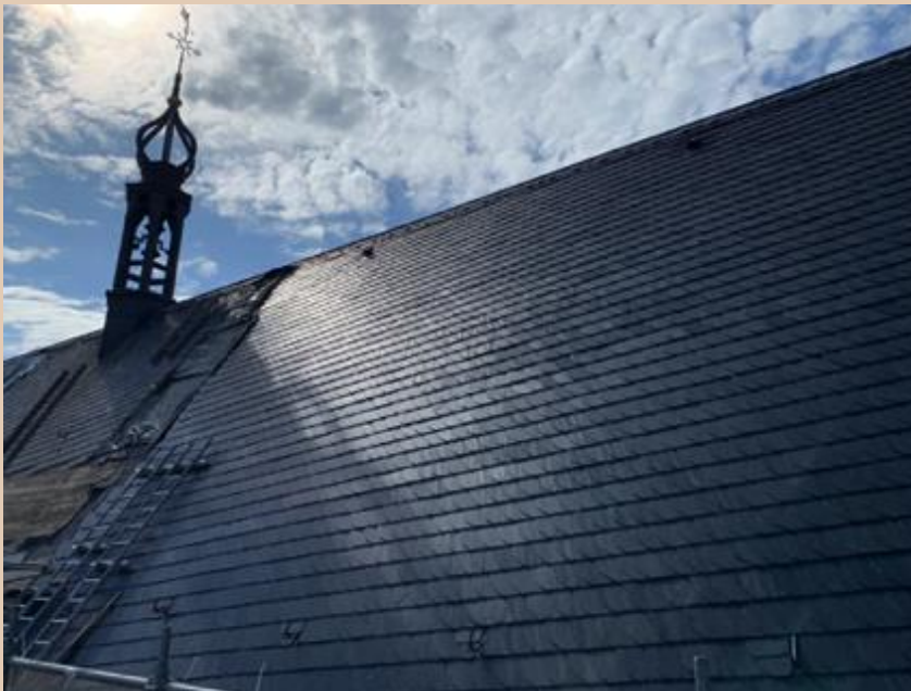
Het nieuwe dak