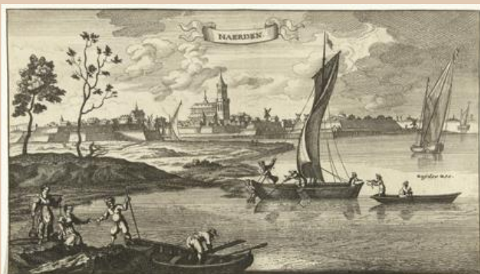
Gezicht op Naarden, Gaspar Bouttats, naar Jan Peeters, 1679.

De digitale nieuwsbrief van Stichting Grote Kerk Naarden werd maandelijks verzorgd. In de nieuwsbrieven werden eigen programmering, concerten en evenementen aangekondigd, maar ook de activiteiten van de Vereniging Vrienden. De nieuwsbrief heeft ca. 1000 abonnees. Ongeveer een derde van de lezers is lid van de Vereniging Vrienden van de Grote Kerk Naarden.