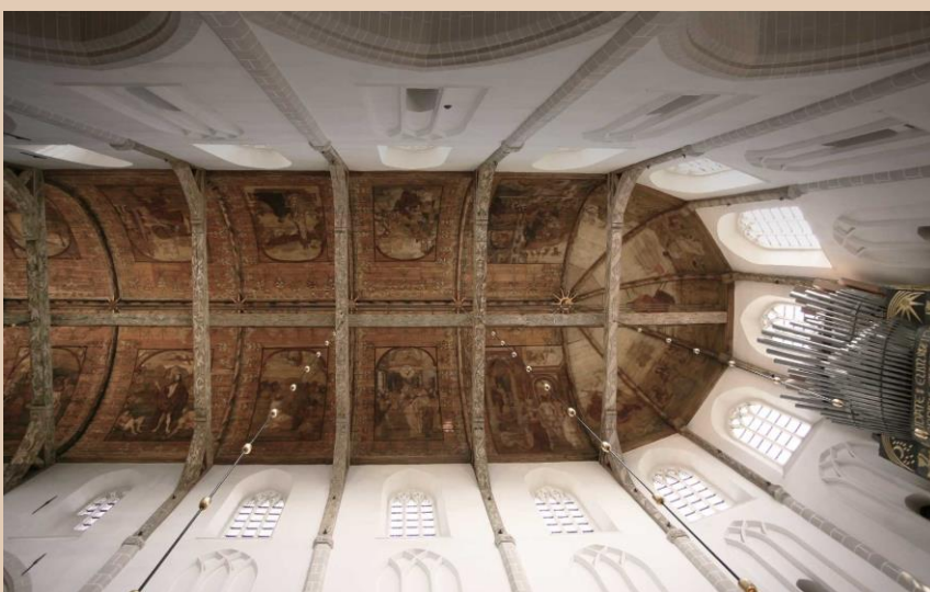
Grote Kerk Naarden beschilderd tongewelf.

Daarnaast is een start gemaakt met het ontwikkelen van het Ondernemingsplan 2023-2026. Hierin is vastgelegd hoe Grote Kerk Naarden vanaf 2023 verder wordt ontwikkeld als muziekpodium, erfgoedbeleving en hart van de samenleving.