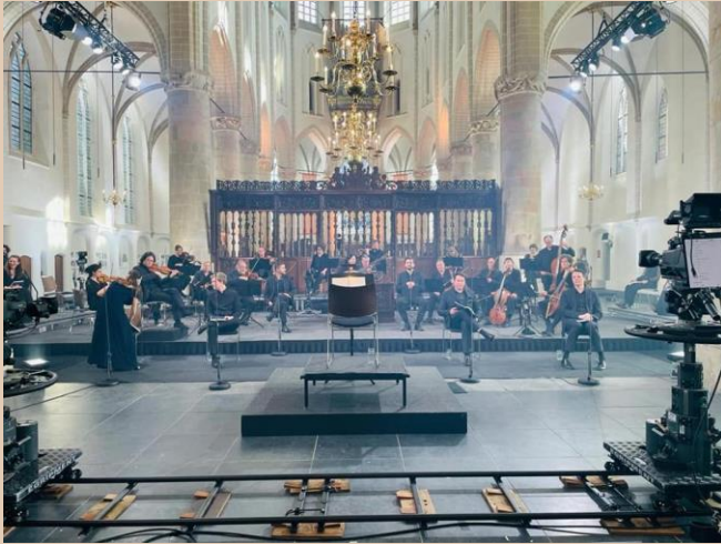
Opmnames van de Johannes Passion