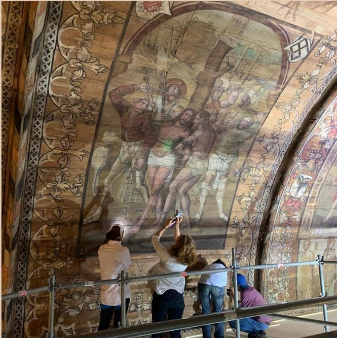
Restauratoren doen opnames aan het gewelf.