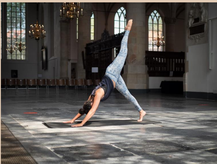
Yoga in de kerk