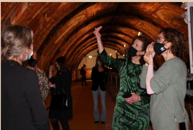
Bezoek Hemelbestormers door de minister van OCW.

Het project Hemelbestormers werd verlengd, waardoor nog eens ruim 4500 bezoekers de schilderijen van het tongewelf konden bewonderen. In april was de presentatie een weekend lang geopend in het kader van een pilot met Testen voor Toegang. Minister van OCW Ingrid van Engelshoven bezocht het project en dit leverde veel publiciteit op. Vanaf half juni was het gebouw weer voor publiek geopend, aan de lockdown kwam toen een einde. Het Fotofestival Naarden vond tegelijkertijd plaats in de Vesting en daarbuiten. In de kerk waren het koor en de kooromgang door het Fotofestival in gebruik, terwijl het schip voor entree voor Hemelbestormers bestemd was. Wij zijn de organisatie van het Fotofestival dankbaar voor hun flexibele opstelling en de mogelijkheid voor het bieden van een combi-ticket.