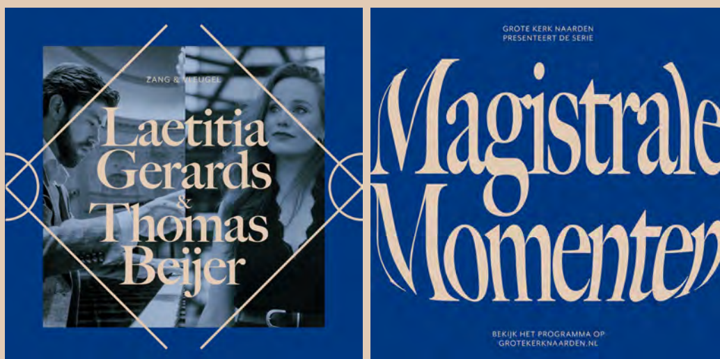
Campagne Magistrale Momenten