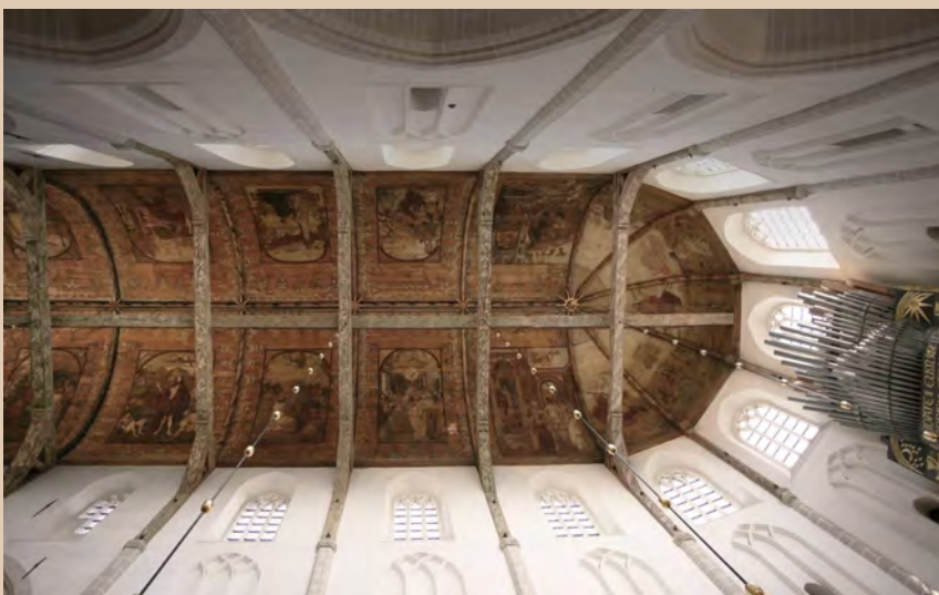
Grote Kerk Naarden beschilderd tongewelf.

Het Ondernemingsplan 2023-2026 werd in 2022 vastgesteld. In het plan staat de ontwikkeling van Grote Kerk Naarden als muziekpodium, erfgoedbeleving en hart van de samenleving centraal, waarbij een evenwicht tussen deze drie pijlers wordt nagestreefd om de beoogde inhoudelijke ontwikkeling mogelijk te maken en de benodigde diversiteit in inkomstenstromen te realiseren.