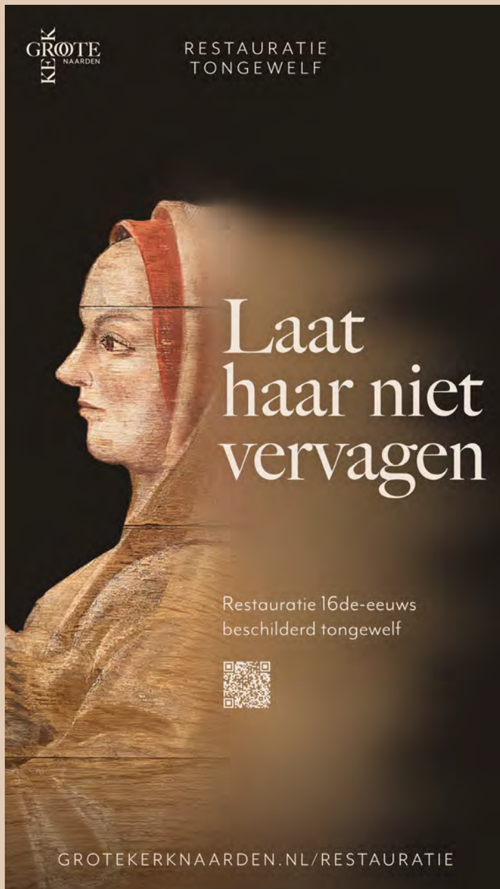
Campagnebeeld Laat haar niet vervagen. Crowdfunding 2022.

In 2022 vormde de communicatiecampagne rond de crowdfunding voor het gewelf één van de hoogtepunten. De campagne Laat haar niet vervagen werd zowel inhoudelijk als qua vormgeving en timing zorgvuldig uitgedacht en dat maakte dat het concept boven verwachting goed aansloeg bij publiek. Bijkomend voordeel van deze campagne aan het begin van de werving voor de restauratie van het gewelf, is dat er particulier commitment mee gecreëerd is en awareness voor de opgave. Hier kan later in het project, met de publieksactiviteiten, weer goed op teruggepakt worden. Met de campagne is inmiddels ruim € 44.000,- opgehaald.