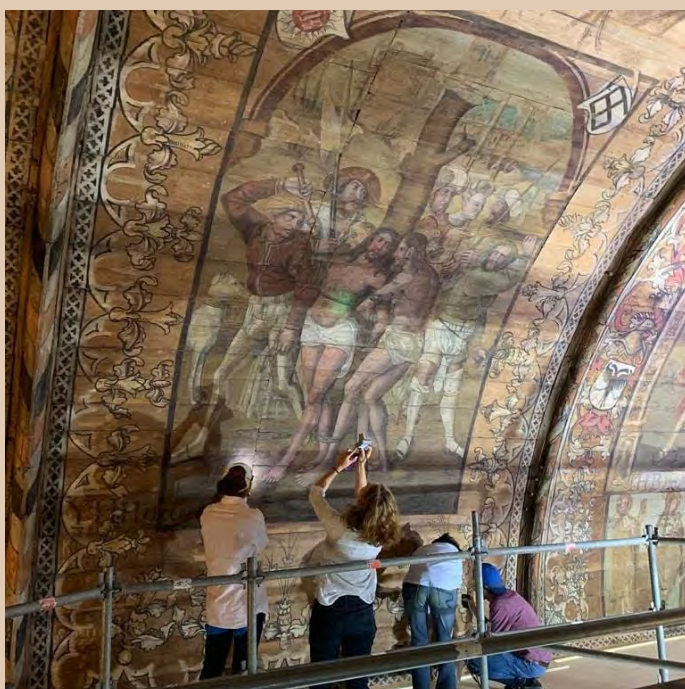
Restauratoren doen opnames aan het gewelf.

In 2022 heeft het restauratieteam een omvangrijk rapport opgeleverd met bevindingen en aanbevelingen. Hieruit blijkt dat restauratie van het hele gewelf noodzakelijk is. Wij hebben dit - o.v.b. financiering van de benodigde 2,6 miljoen euro - ingepland vanaf najaar 2024. Wij kunnen de restauratie niet vanuit onze exploitatieopbrengsten bekostigen. Zoals eerder in dit verslag aangegeven is de werving van een mix van publieke en private middelen in volle gang. Samenwerking met universiteiten en de Rijksdienst voor het Cultureel Erfgoed maakt onderdeel uit van het project.