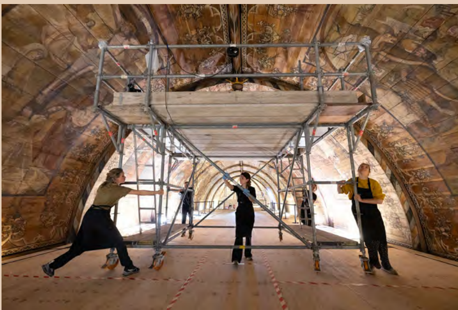
Verplaatsing van de grote rolsteiger

Binnen de SRR-regeling werd van september 2020 tot april 2021 een conditie-onderzoek uitgevoerd aan het 16de-eeuwse beschilderde tongewelf door een team van vier restauratoren in samenwerking met de Rijksdienst voor het Cultureel Erfgoed. Vochtschade als gevolg van lekkages van het dak en andere beschadigingen gaven reden voor onderzoek naar de noodzaak van een restauratie. Het is bijzonder dat er eerst een conditie-onderzoek is uitgevoerd. Bij dergelijke kunstwerken moet vaak vanaf de vloer worden ingeschat of restauratie nodig is. Met behulp van een innovatieve digitale techniek uit Duitsland zijn de schilderijen laag voor laag in kaart gebracht. De licentie voor deze techniek is aangekocht door de Rijksdienst voor het Cultureel Erfgoed en voor het eerst in Nederland ingezet binnen ons project.