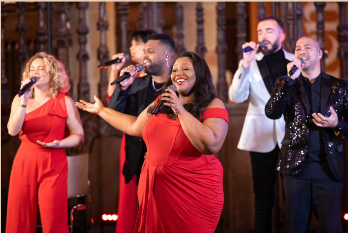
Magistrale Momenten – ZO! Gospel Choir

De eigen series Magistrale Momenten en Orgel Anders zijn vaste waarden in de programmering en geven het seizoen een herkenbaar karakter.