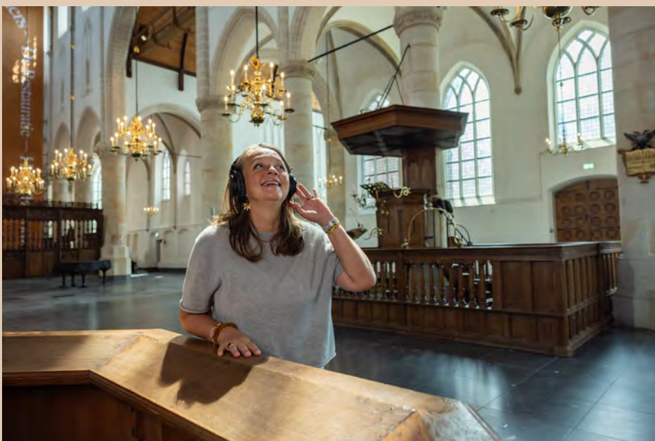
Audiobeleving De Hemel op Aarde

De bestuurder verklaart dat de interne risicobeheersings- en controlesystemen in het verslagjaar 2025 naar behoren hebben gefunctioneerd en een redelijke mate van zekerheid bieden dat de financiële verslaggeving geen onjuistheden van materieel belang bevat.