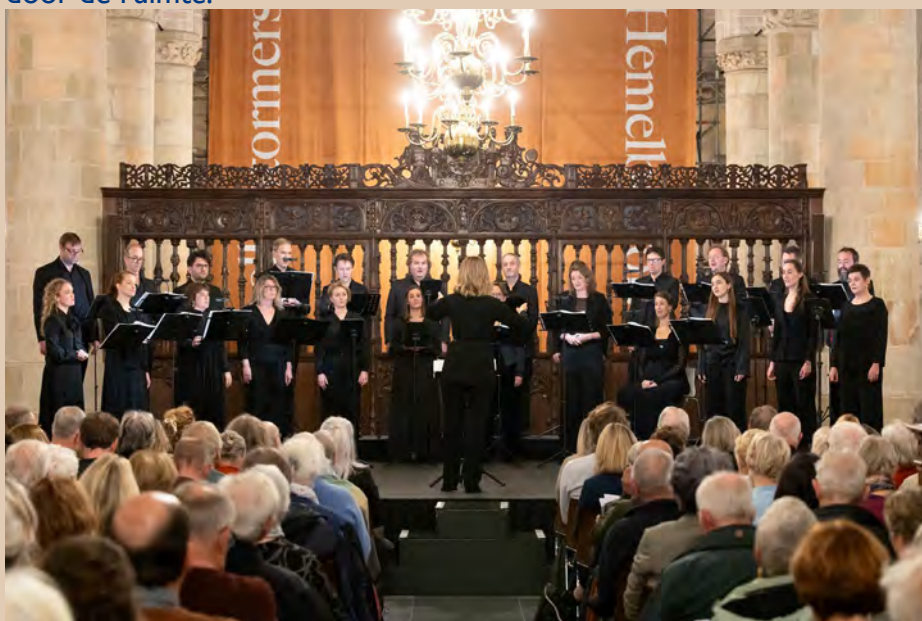
Path of Miracles - Cappella Amsterdam

Binnen het meerjarenbeleid hebben we gewerkt aan nieuwe relaties met professionele gezelschappen met repertoire dat aansluit bij de ruimte en akoestiek. In 2025 stond in dat kader bijvoorbeeld Cappella Amsterdam voor het derde jaar in Grote Kerk Naarden. De Nederlandse Händelvereniging voerde onder andere de Messiah uit, inmiddels ook een jarenlange traditie. De seizoenbrochure die we sinds een aantal jaar uitgeven, biedt een mooi gebalanceerde programmering en veel achtergrondinformatie over zowel muziek als monument. Grote Kerk Naarden is immers een echte muziekkerk, met een architectuur die klanken hemels laat buitelen door de ruimte.