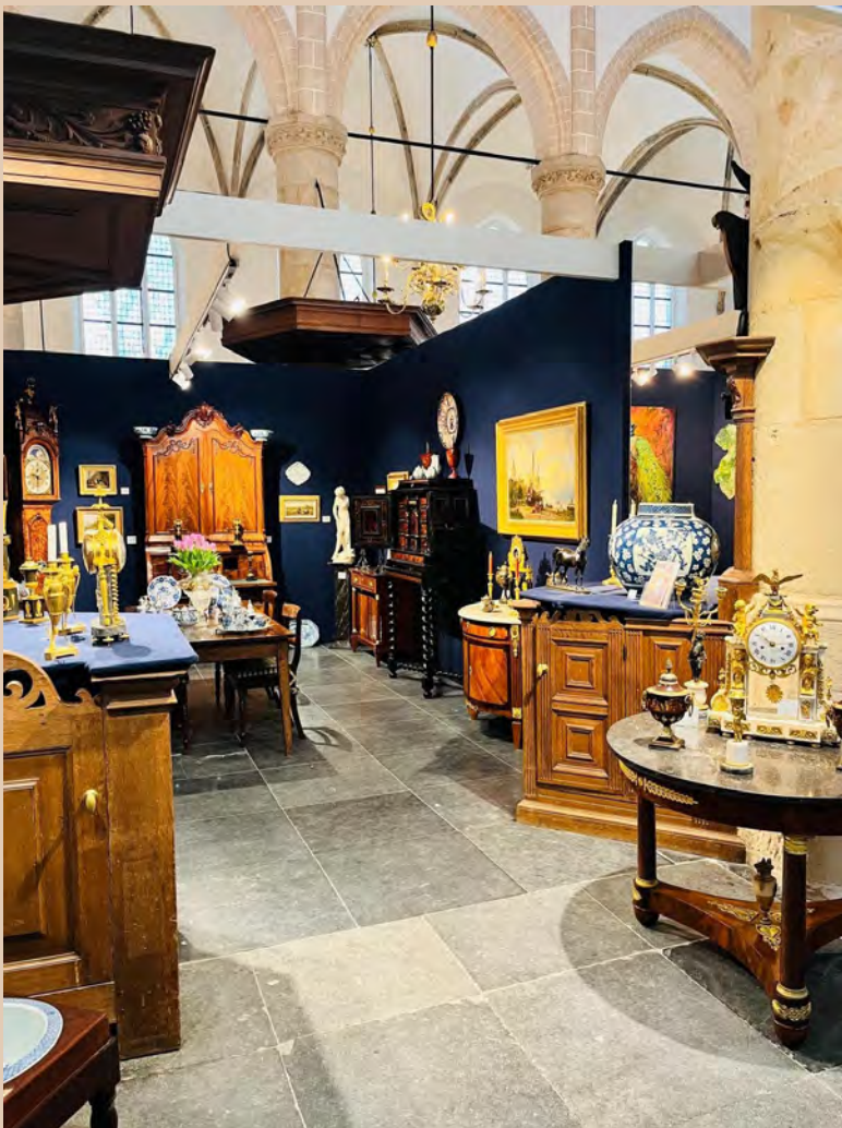
NAARDEN The Art Fair

De zakelijke bijeenkomsten lieten in 2025 een duidelijke groei zien. Het jaar begon met een nieuwjaarsbijeenkomst voor Meerdervoort, gevolgd door een relatiediner van Loyens & Loeff. In maart verwelkomden we de tiende editie van Gooi on Stage, waarbij ruim 800 vmbo-scholieren in aanraking kwamen met het bedrijfsleven — een evenement dat de kerk vult met de energie van een nieuwe generatie. De Gemeente Gooise Meren gebruikte onze ruimte naast de jaarlijkse Lintjesregen nog tweemaal: in mei voor de slotbijeenkomst van de Kerkenvisie, en in december voor een feestelijke vrijwilligersavond. Het jaar werd afgesloten met een personeelsfeest van SKBNM Kinderopvang.