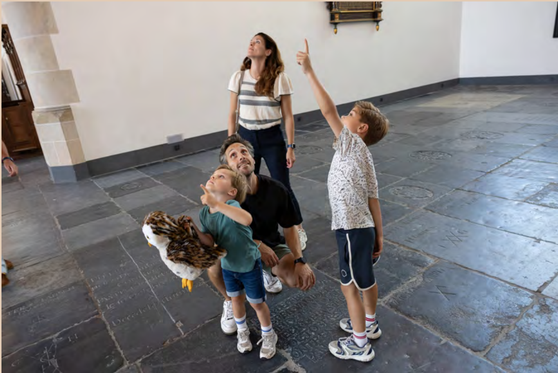
Tyto de kerkuil

details in het gebouw en ontdekken zij het erfgoed op hun eigen niveau. Daarmee werd een belangrijke stap gezet in het toegankelijk maken van de kerk voor families. De combinatie van restauratiebeleving, audiobeleving, kinderprogramma en museale ontvangst zorgde ervoor dat Grote Kerk Naarden in de zomer van 2025 een groeiend publiek wist te bereiken van 4.700 bezoekers. Daarmee zetten we onze eerste schreden als museumorganisatie.